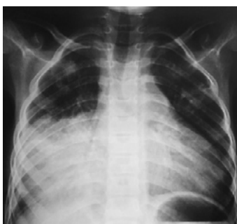
Figure 3 : Radiothorax à 2 mois de traitement.