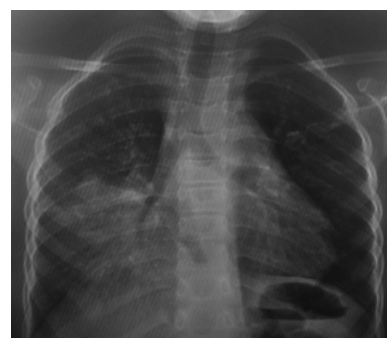
Figure 5 : Radiothorax à 12 mois de traitement : opacité calcifiée du lobe moyen.

TDM thoraco-abdominale de contrôle (10 mois de traitement) : aspect stable de la condensation parenchymateuse lobaire moyenne légèrement nécrosée entourée par une coque périphérique calcifiée, cette condensation s'étend vers la région médiastino-hilaire, englobant l'artère lobaire moyenne, la veine pulmonaire supérieure droite et obstruant la bronche lobaire moyenne. Devant ces données évolutives nous avons discuté soit une mauvaise observance du traitement antituberculeux ; Un sous dosage, l'izonidémie sous la posologie de 10mg/kg/j = 3,24 avec un indice d'acétylation à 0,42 soit un acétyleur long d'où l'adaptation de la posologie ; Une antibio-résistance mais une résistance à la rifampicine non détectée par la PCR GENEXPERT ; Une greffe aspergillaire mais l'antigénémie aspergillaire était négative. La décision était de prolonger le traitement antituberculeux pour une durée totale de traitement de 12 mois. la radiothorax en fin de traitement montrait une opacité calcifiée du lobe moyen( Figure 5).