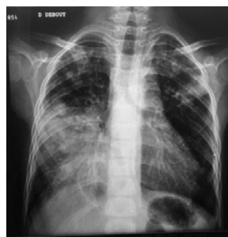
Figure 1 : Radiothorax à l'admission : opacité alvéolaire lobaire moyenne, deux opacités biapicales mal limitées.

à l'admission montrait une opacité alvéolaire lobaire moyenne, et deux opacités bi-apicales mal limitées (figure N°1).